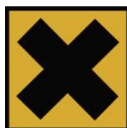
Xn - Nocif