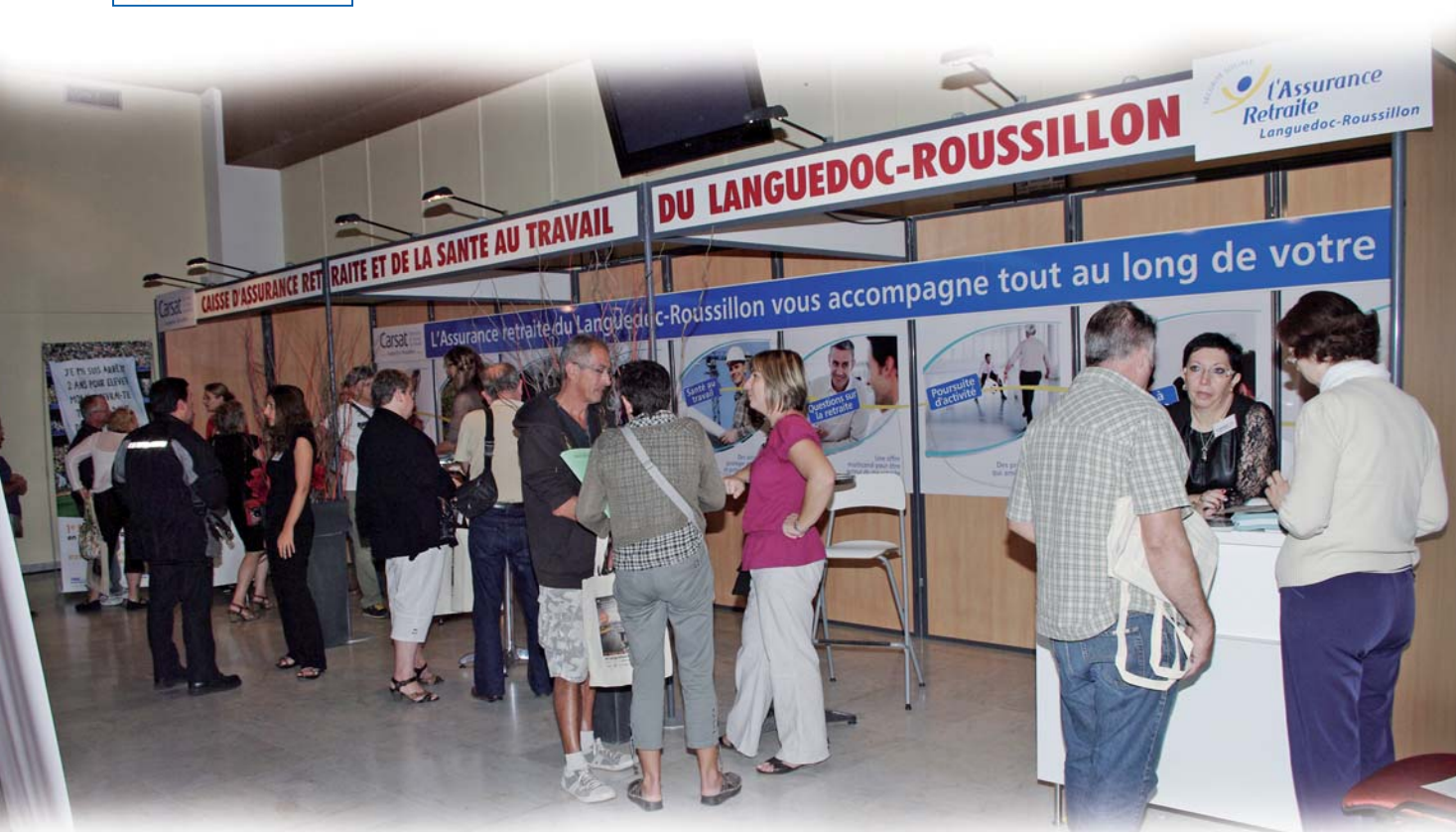
87% des visiteurs sont satisfaits des informations sur la retraite

Notre 1 er Salon Régional de la Retraite (Béziers, les 30 sept. et 1 er oct. 2011 - 2 000 visiteurs) est un exemple fort de notre volonté de se situer au plus près des assurés pour expliquer les nouvelles règles et informer sur notre offre de protection sociale, conformément à notre mission de service public.